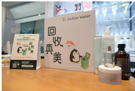
圖說：參與品牌門市回收箱接受不同種類的美容產品空瓶。