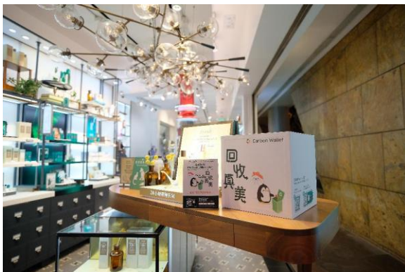
圖說：「回收真美」計劃透過在參與品牌的門市設立回收點，建立更方便的回收網絡，從而鼓勵消費者在用完美容產品後回收包裝容器。